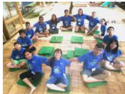
фото и кино.

Программа Школы Росатома была выстроена на российских педагогически технологиях, обеспечивающих развитие детей в процессе образовательных событий и проектной деятельности. Ведущей идеей Программы стало конструирование средств общения, выход в метаязыки – язык тела, язык рисунка, язык