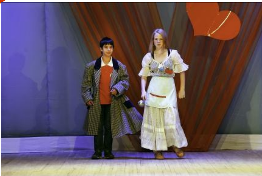
борщевиха и всемирно известный Суриков