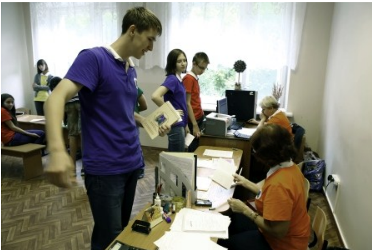
Биржа в режиме реального времени