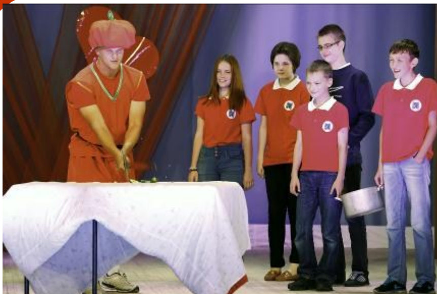
сварганим супер борщ