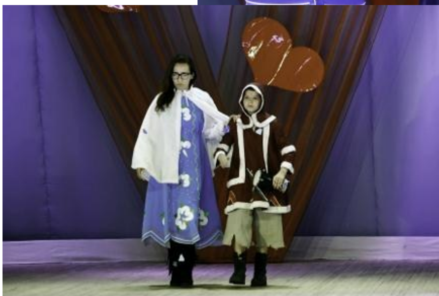
«Мистер и мисс»