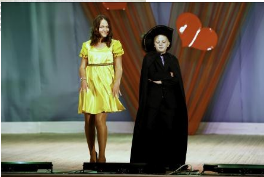
яркое солнце из «Sun city»