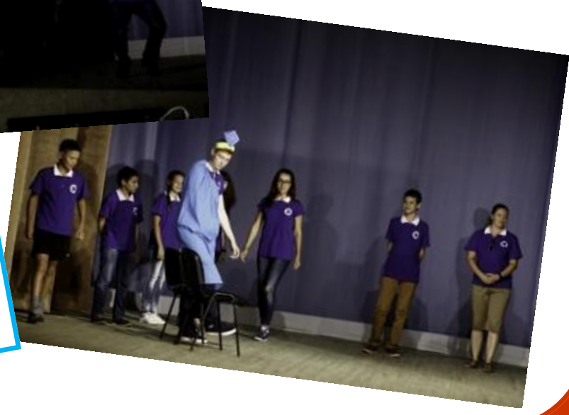
ГРАНИ ТАЛАНТА СИЯЮТ, ВСЕ ЭТО ВИДЯТ И ЗНАЮТ