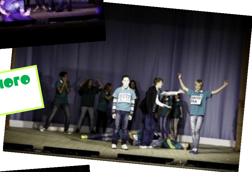
РАДОСТЬ И ШКОЛЬНОГО ПОДВОРЬЯ!