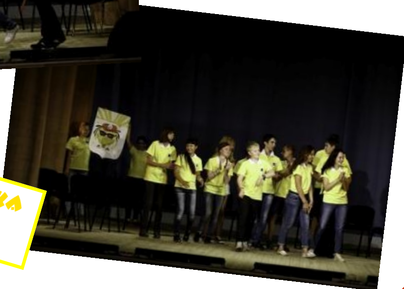
ВОТ У КОГО СОЛНЫШКА ПРОСИТЕ!