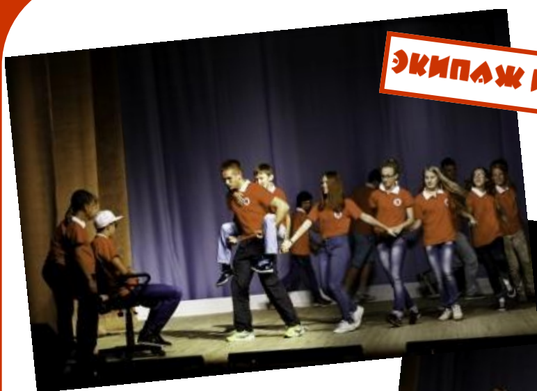
ЭКИПАЖ ИЗ ВЕРХНИХ БОРЦЕЙ