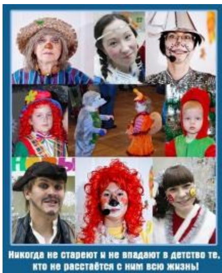
Никогда не стареют и не впадают в детство те, кто не расстанется с ним всю жизнь!

С 10 по 15 июня время для участников Школы уплотнилось. Каждый день завершался командными соревнованиями: веревочный курс «Ш И К а р н ы й кросс», спортивно-игровая программа «Шанс – Игра – Команда», робототехника». В них ребята продемонстрировали сплоченность, настроенность на командное взаимодействие и результат.