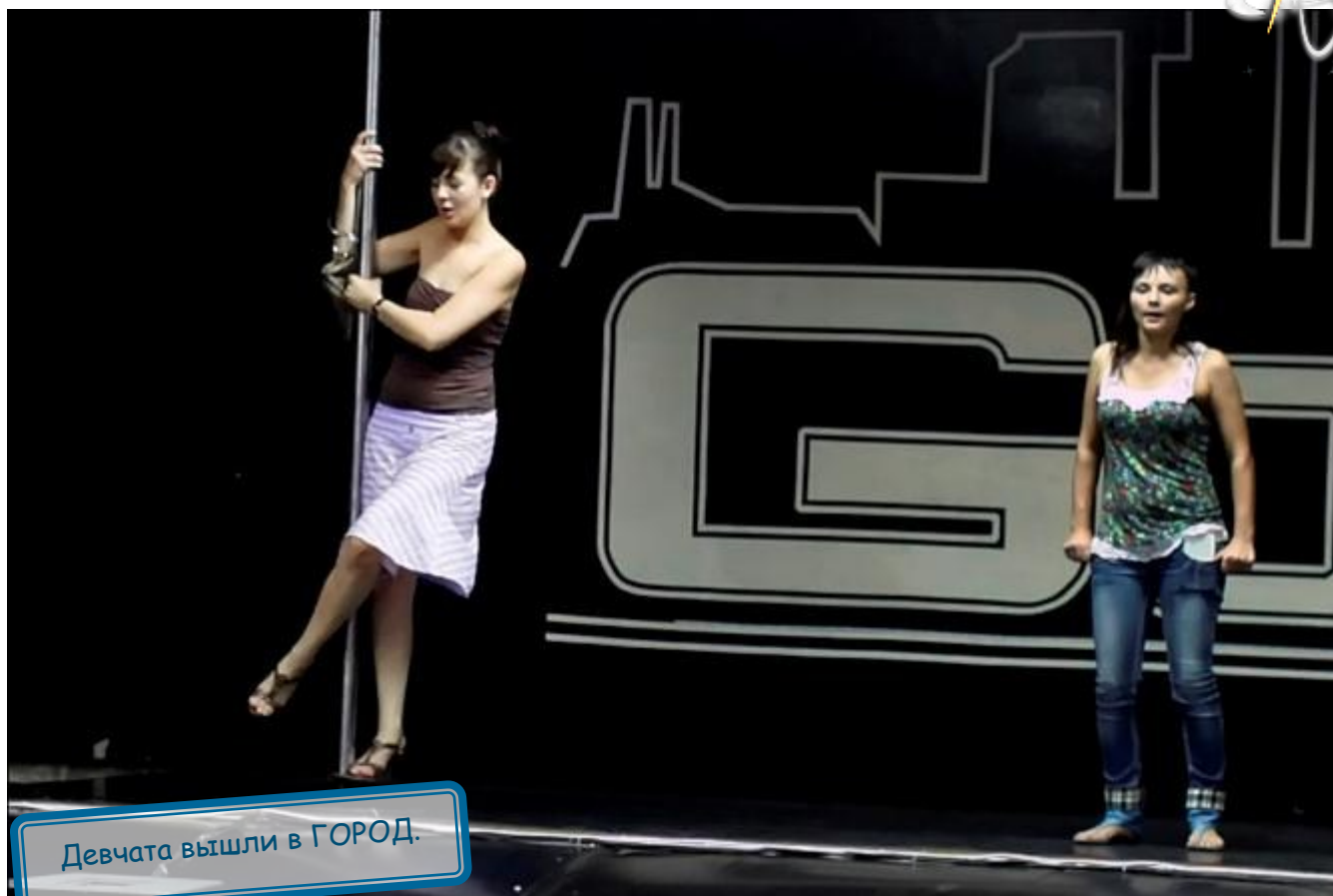
Девчата вышли в ГОРОД.