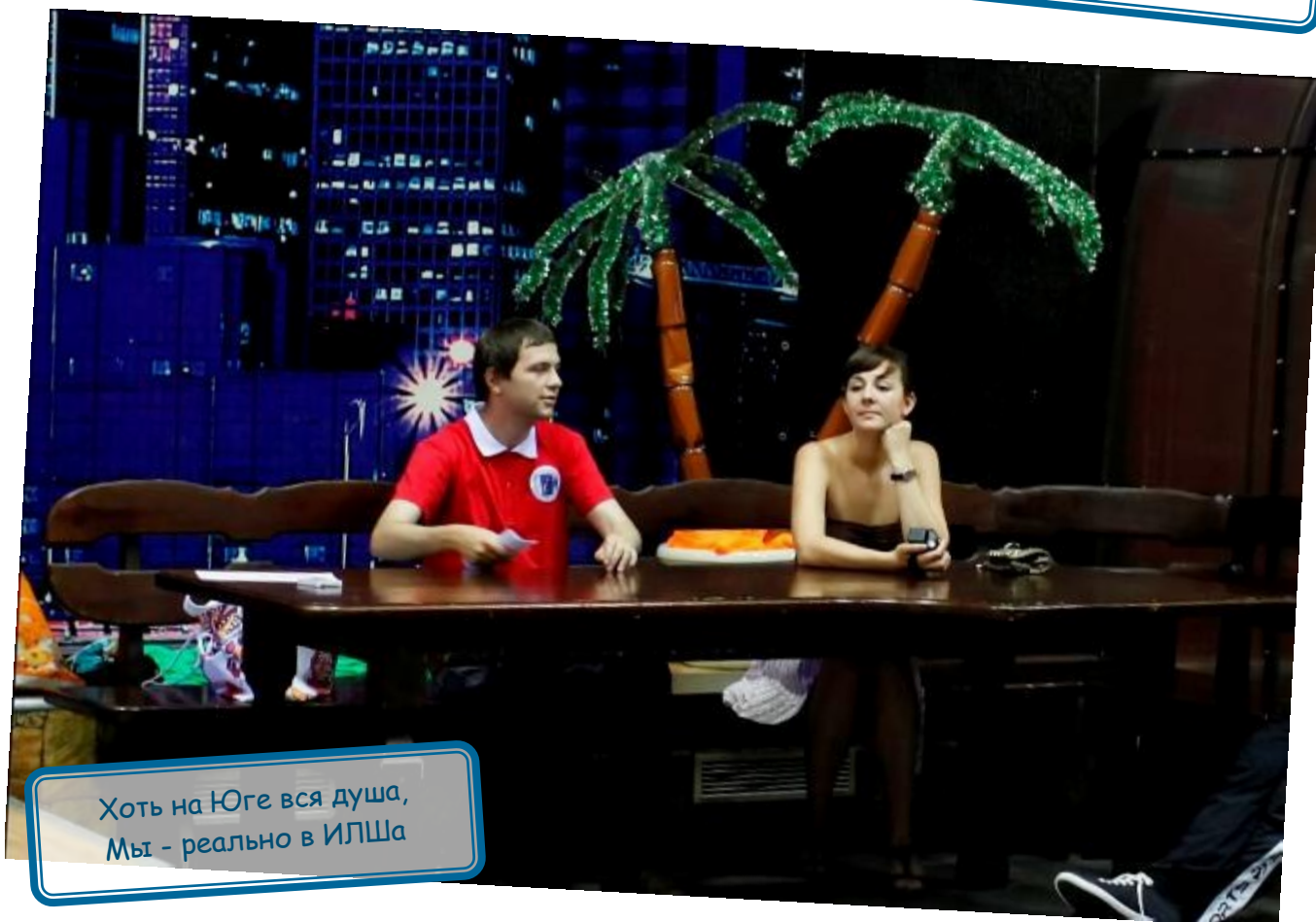
Хоть на Юге вся душа, Мы - реально в ИЛШа