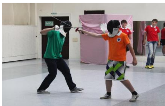
Сэр! Я вызываю вас на дуэль.