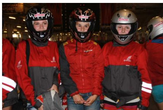
Ну что , девочки, повторим по- двиг В. Терешковой?