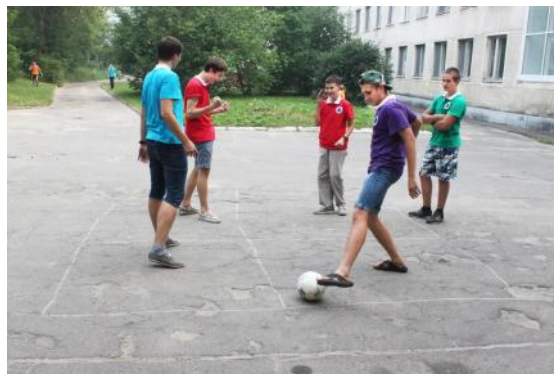
О, спорт! Ты - мир!