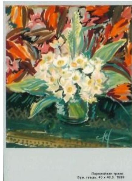
Переходный период. Бум. гуашь. 40 x 45.5. 1999