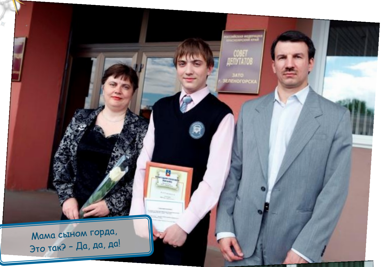
Мама сыном горда, Это так? - Да, да, да!