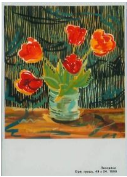
Лазоркина Бум. гуашь, 49 x 54, 1999

Я пишу. Звенят тихонько колокольчики, поют таежные песенки веточки и листики. Блестят росинки драгоценными капельками. Крохотные нежные полевые цветочки робко выглядывают сквозь бурные кудрявые папоротники. И все они ведут себя благородно и с достоинством. Такие вот Гости из леса были у меня на дне рождения и принесли с собой прохладу, покой и запахи тайги.