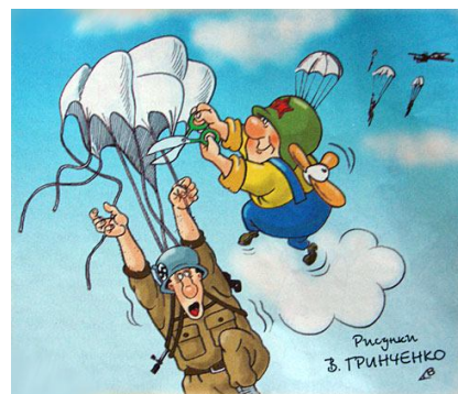
Рисунки З. ГРИНЧЕНКО

Сейчас я разберусь как следует и нака- жу кого попало.