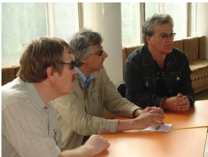
Наши мэтры педагогики