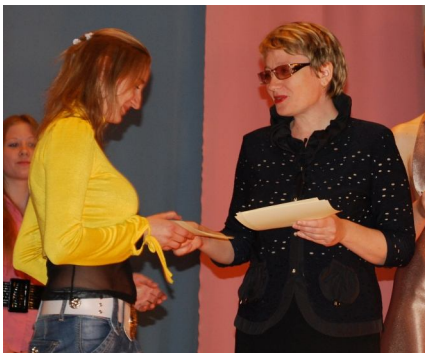
Научили... и вручили

В школах РФ сегодня работает почти 1,4 миллиона представителей этой благородной профессии. В среднем на одного педагога приходится девять учеников. Около 800 тысяч учителей получают ежемесячное вознаграждение за классное руководство. С 2006 года в рамках нацпроекта «Образование» 40 тысяч учителей-победителей конкурсов из всех регионов стали обладателями президентской премии в размере 100 тысяч рублей.