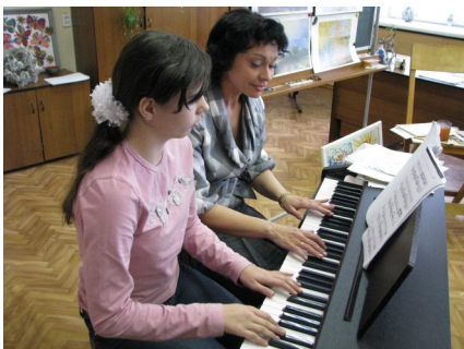
Волшебные звуки музыки