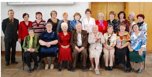
Встреча с педагогами-ветеранами